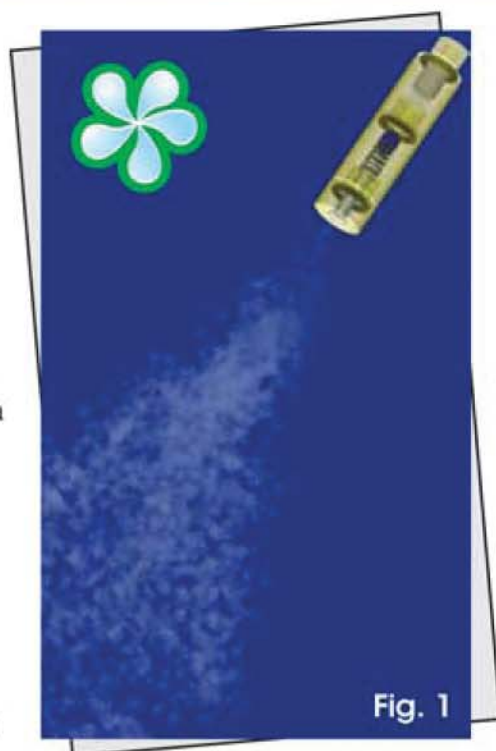
Millions of less than 10 microns droplets sprayed by our fog nozzle.

These tiny water droplets quickly absorb the energy (heat) present in the environment and evaporate, becoming water vapor (gas). The energy (heat) used to change the water to a gas is eliminated from the environment, hence the air is cooled.