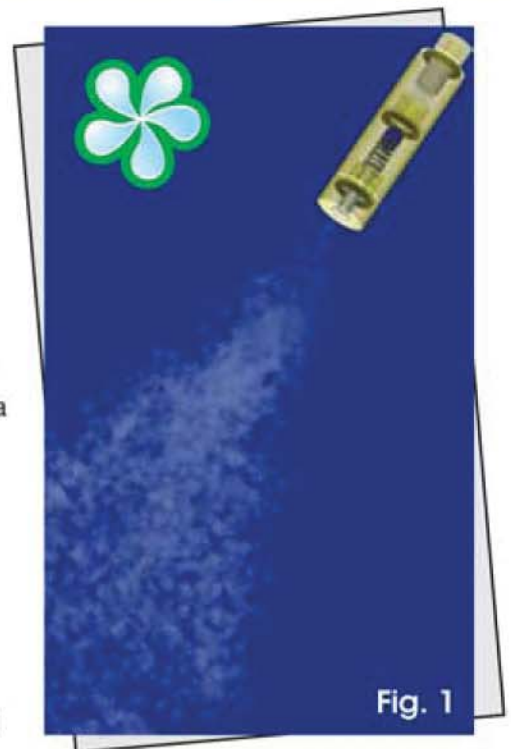
Millions of less than 10 microns droplets sprayed by our fog nozzle.

These tiny water droplets quickly absorb the energy (heat) present in the environment and evaporate, becoming water vapor (gas). The energy (heat) used to change the water to a gas is eliminated from the environment, hence the air is cooled.